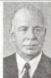
М. В. Підгорний (1957–1963)