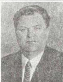
О. І. Кириченко (1953–1957)