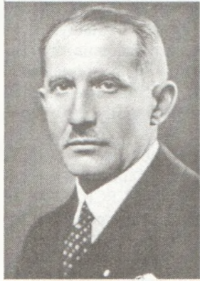
Євген Коновалець (1891–1938) — засновник Української Військової Організації, голова Проводу Українських Націоналістів

Народився в учительській родині в с. Зашкові на Львівщині, закінчив Львівський університет. За його власним зізнанням, найбільший вплив на нього мали пропагандист спорту І. Боберський та Д. Донцов.