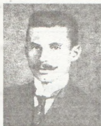
Липинський В'ячеслав (1882–1931) — історик, публіцист, теоретик українського консерватизму

Народився в селі Затурці на Волині в польській шляхетській родині. Пристав на українські позиції, вважаючи, що ополяченій і польській шляхті в Україні потрібно визначитись: чи буде вона з народом, а чи залишиться в ролі колонізатора. Брав участь у політичному житті України часів революції, 1919 р. Емігрував. Головна політична праця — «Листи до братів-хліборобів» (1926). Прихильник монархічної форми правління на кшталт гетьманату. Одним з перших побачив тоталітарну схожість фашизму і комунізму. Критикував як українських комуністів, так і послідовників Д. Донцова й ОУН. Покладав відповідальність за поразку українських визвольних змагань на соціалістів і демократів. Був прибічником багатопартійності та демократичного устрою, тому критикував «смертельну однобічність нації», коли перевагу мають крайні ліві або крайні праві партії. Погляди В. Липинського не набули поширення в українських землях, але вплинули на формування поглядів національної науково-політичної еліти за кордоном