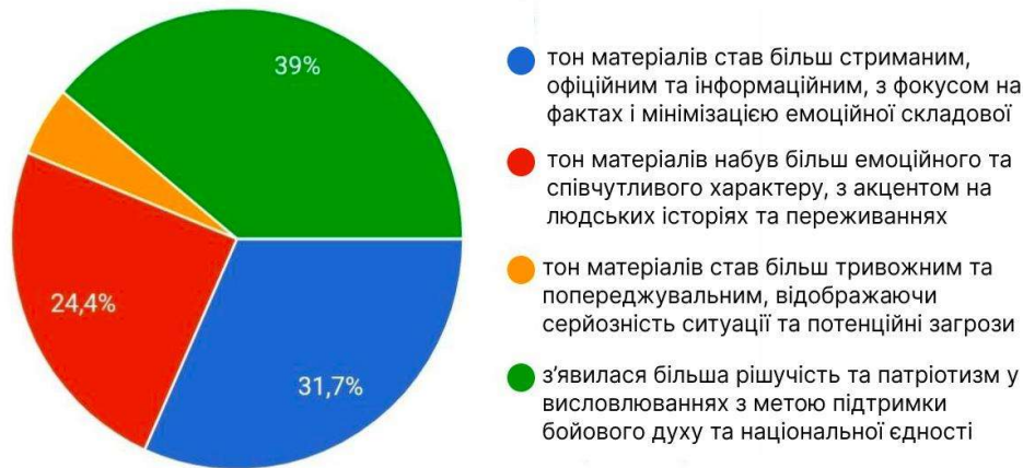
Рис. 2. Пріоритетні вектори трансформації тональності медіаматеріалів про війну за оцінками респондентів

Ключовими детермінантами цих трансформацій респонденти назвали рішучість та патріотизм (39%) й емоційно-емпатичний компонент (24,4%) (рис. 2).