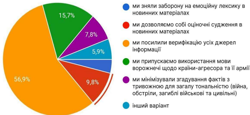
Рис. 3. Розподіл відповідей щодо впливу психологічних факторів на професійне редагування текстів

Паралельно зафіксовано лексичні зрушення в медіадискурсі, коли використання стилістично маркованої лексики на адресу окупантів перетворилось на інструмент психологічної мобілізації суспільства. Це явище привертало увагу своєю незвичністю, однак не набуло масового характеру. Зокрема, серед респондентів нашого опитування на запитання «Які психологічні чинники воєнного часу впливають на підходи вашої редакції до редагування журналістських матеріалів?» усього 15,7% зазначили, що допускають використання лексики ворожнечі щодо агресора, 9,8% вказали на можливість використання оціночних суджень стосовно окупантів, і лише незначна частка респондентів повідомила про зняття обмежень на застосування емоційно забарвленої лексики (рис. 3).