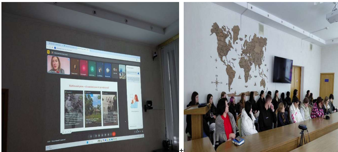
Рис. 3. Заходи до щорічного тижня академічної доброчесності

Увагу приділяють академічній доброчесності як складовій навчання та активній діяльності: відмова від плагіату, самостійне виконання завдань та проєктів, незловживання штучним інтелектом та достовірність фактів. Окрім того, що здобувачі освіти підписують декларації про академічну доброчесність, на кафедрі ініційовано низку заходів, які націлені на практичну складову вищепианого. Окрім систематичних вебінарів та зустрічей, куди запрошують учасників освітнього процесу, кафедра журналістики є організатором щорічного тижня академічної доброчесності в Навчально-науковому інституті філології та журналістики.