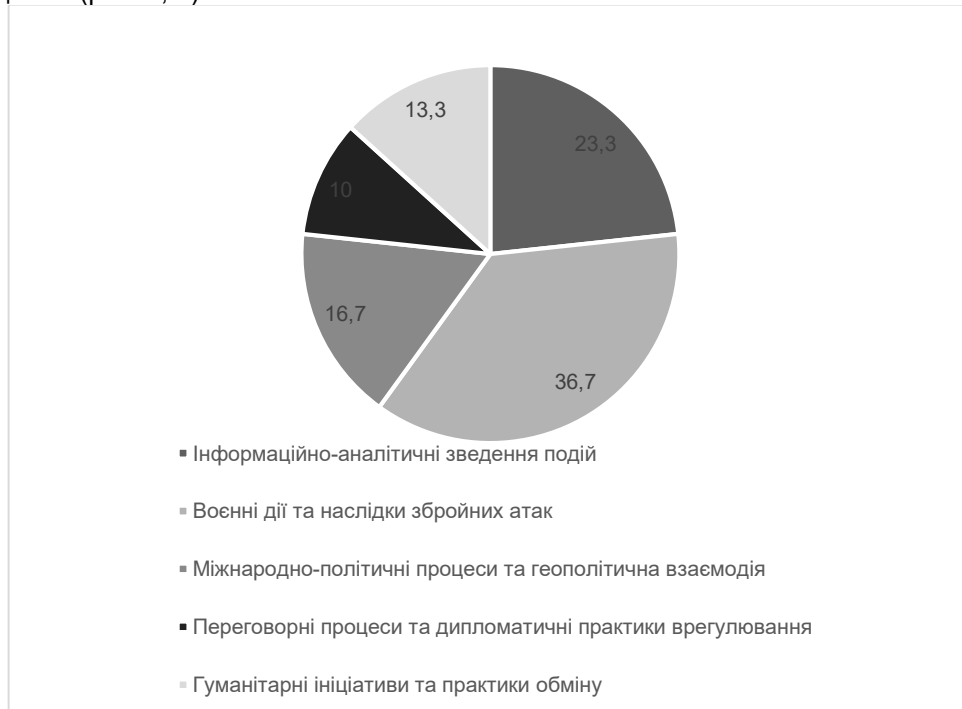
Рис. 1. Тематичний розподіл заголовків телемарафону «Єдині новини» у 2024 р. ( n = 60 ; %)

Тематичну класифікацію здійснено за наперед визначеними категоріями: інформаційно-аналітичні зведення подій; воєнні дії та наслідки збройних атак; міжнародно-політичні процеси та дипломатичні практики урегулювання. Результати подано у відсотках (%) від загальної кількості заголовків у межах відповідного року, що забезпечує коректність зіставлення тематичної структури та можливість аналізу динаміки інформаційних акцентів (рис. 1, 2).